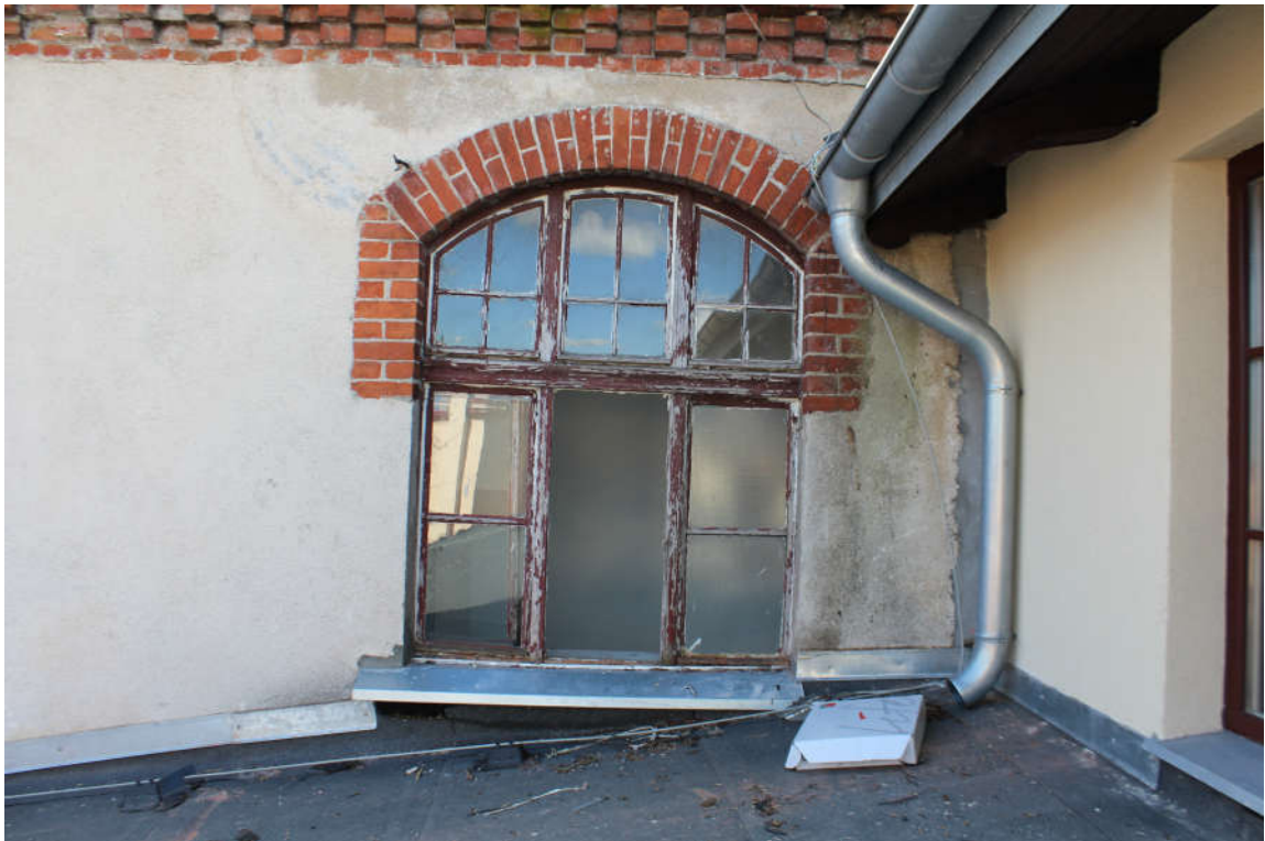
Okno nr 8 widok od zewnątrz.