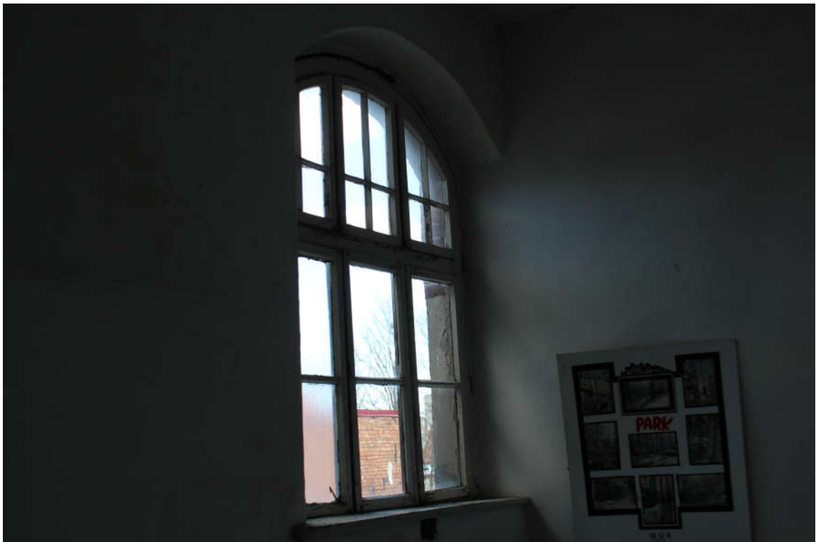
Okno nr 8 widok od wewnątrz.