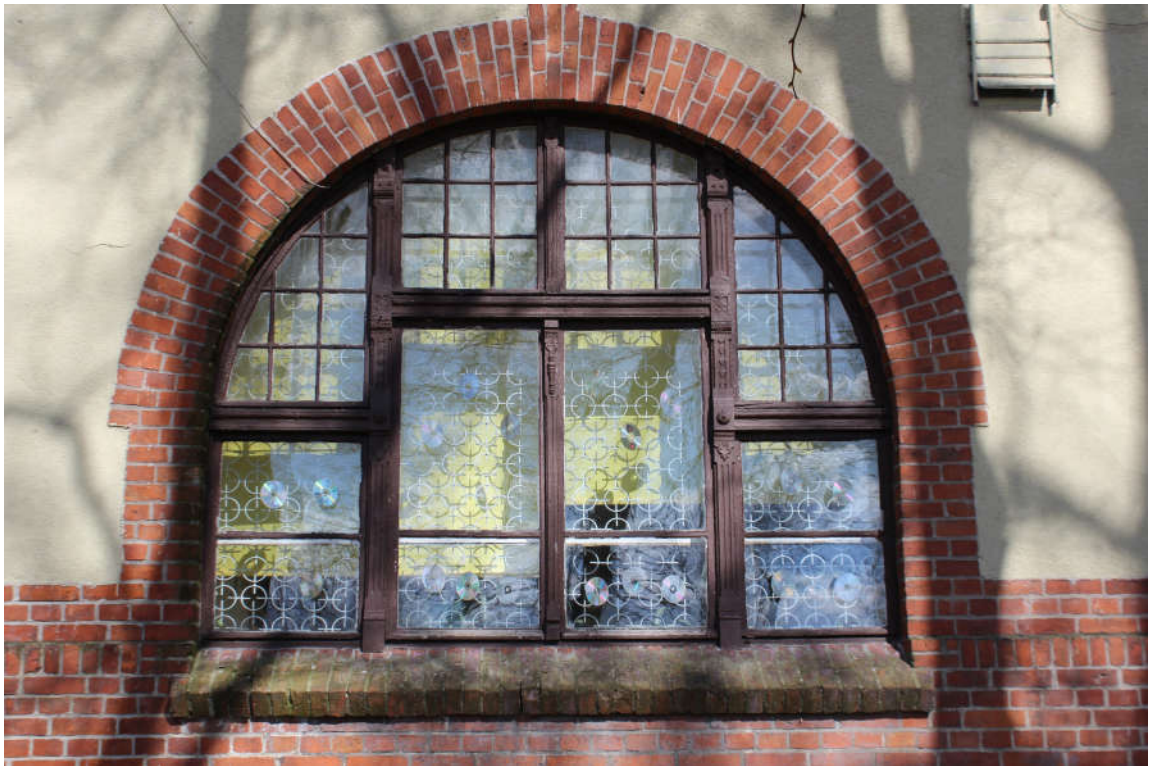
Okno nr 3 widok od zewnątrz.