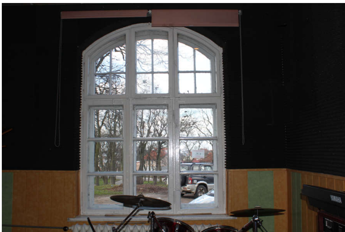
Okno nr 4 widok od wewnątrz