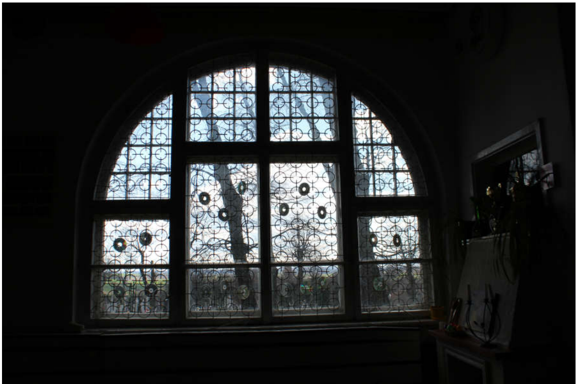
Okno nr 3 widok od wewnątrz.