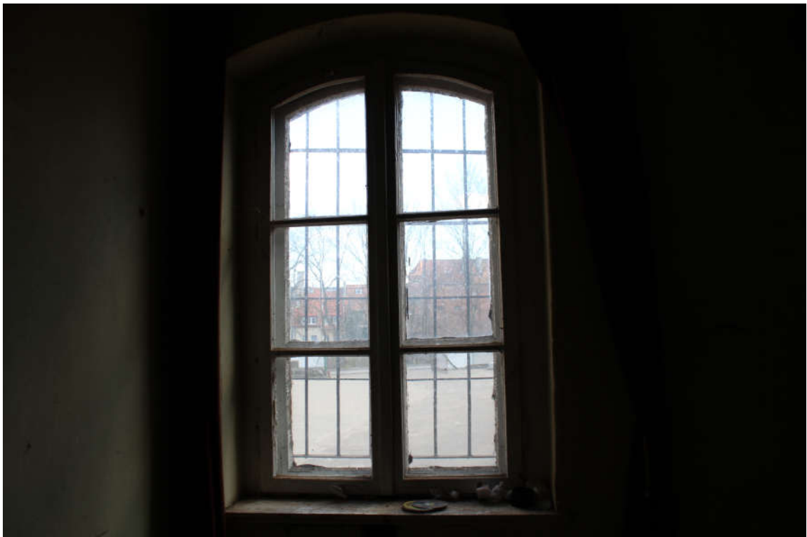
Okno nr 10 widok od wewnątrz.